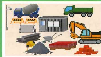
工事現場・機材置場